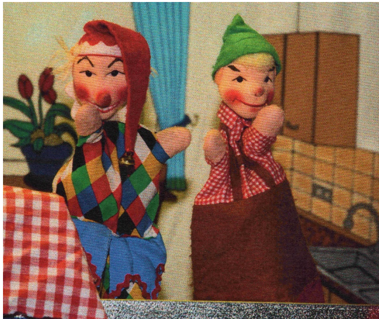
Lieblinge der Kinder : Kasperle und sein Freund Seppel

Die Wirtin des TVA-Clubheims überließ uns dankenswerterweise ihren separaten Raum zur Aufbewahrung der in diesem Jahr extrem hohen Anzahl von Sachspenden und unserer Ausstattung, so dass die bisher umständliche Logistik für den Schützenfest-Montagmorgen deutlich entschärft und erleichtert wurde. Darüber hinaus gilt es an dieser Stelle, den engagierten Mitgliedern der Andreas-Hofer-Gruppe ebenfalls für ihre tatkräftige Unterstützung beim Transport und bei der Durchführung der Kinderbelustigung herzlich zu danken.