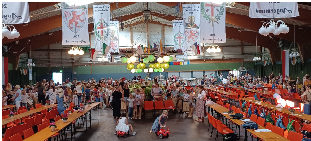
Blick in die Schützenhalle während der Kinderbelustigung

Jetzt galt es festzustellen, mit wie vielen Kinder wohl zu rechnen sei und hier kamen wir nicht mehr aus dem Staunen heraus. Die komplette Grundschule Angermund und vier Kindergärten sicherten ihre Teilnahme incl. Lehrer und Erzieher/innen zu, somit war auf einmal mit ca. 500 Kinder zu rechnen.